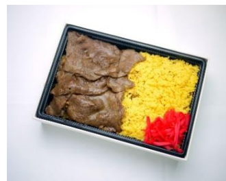
黄金そばめし 価格：1080円税込