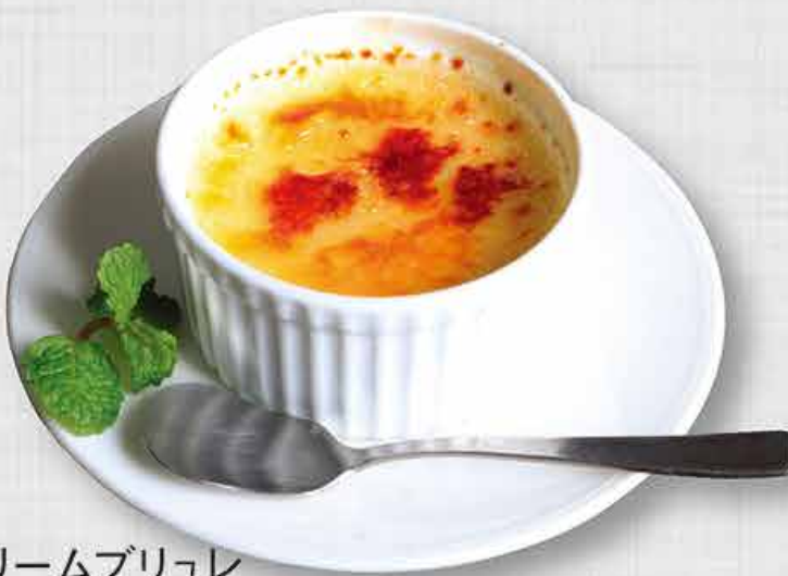
クリームブリュレ 58,000 vnd