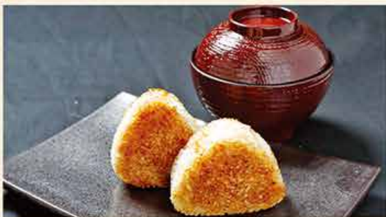
焼きおにぎり (みそ汁付き) 68.000 vnd