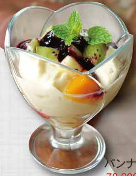
パannaコッタ 78,000 vnd