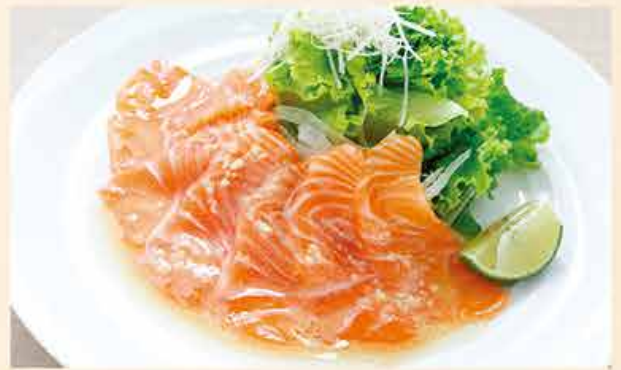
サーモンカルパッチョ