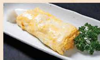
鉄板だし巻 78.000 vnd