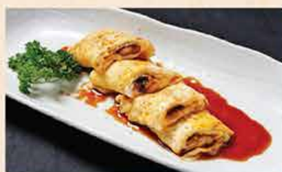
鉄板う巻 138.000 vnd