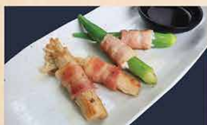
野菜ベーコン巻き 68.000 vnd