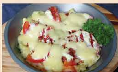
ポテサラチーズ 焼き 68.000 vnd