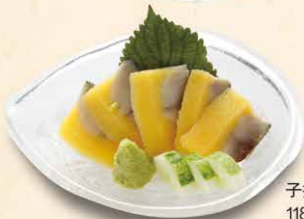
子持ちニシン 118.000 vnd