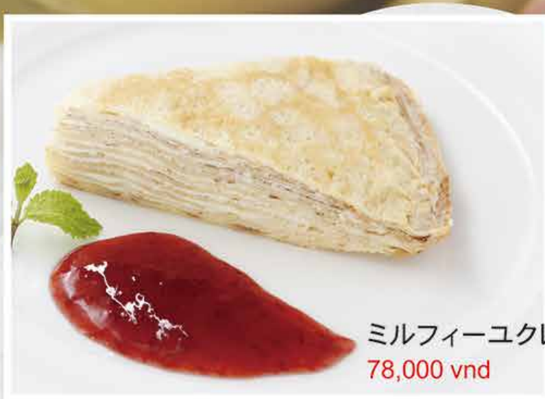
ミルフィーユクレープ 78,000 vnd