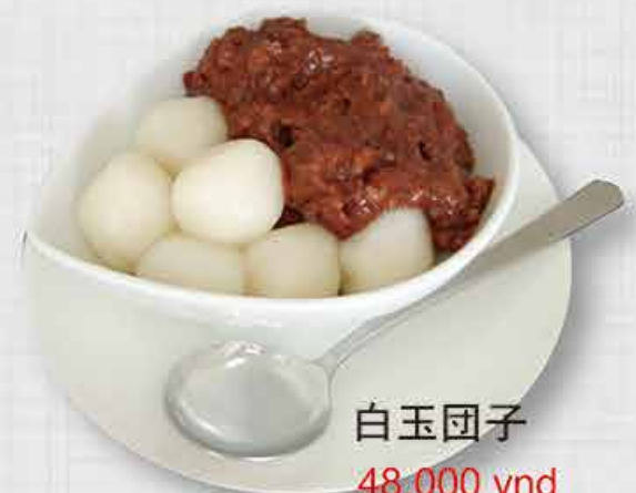
白玉団子 48,000 vnd