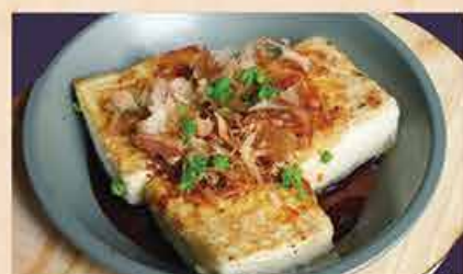
豆腐ステーキ 78.000 vnd