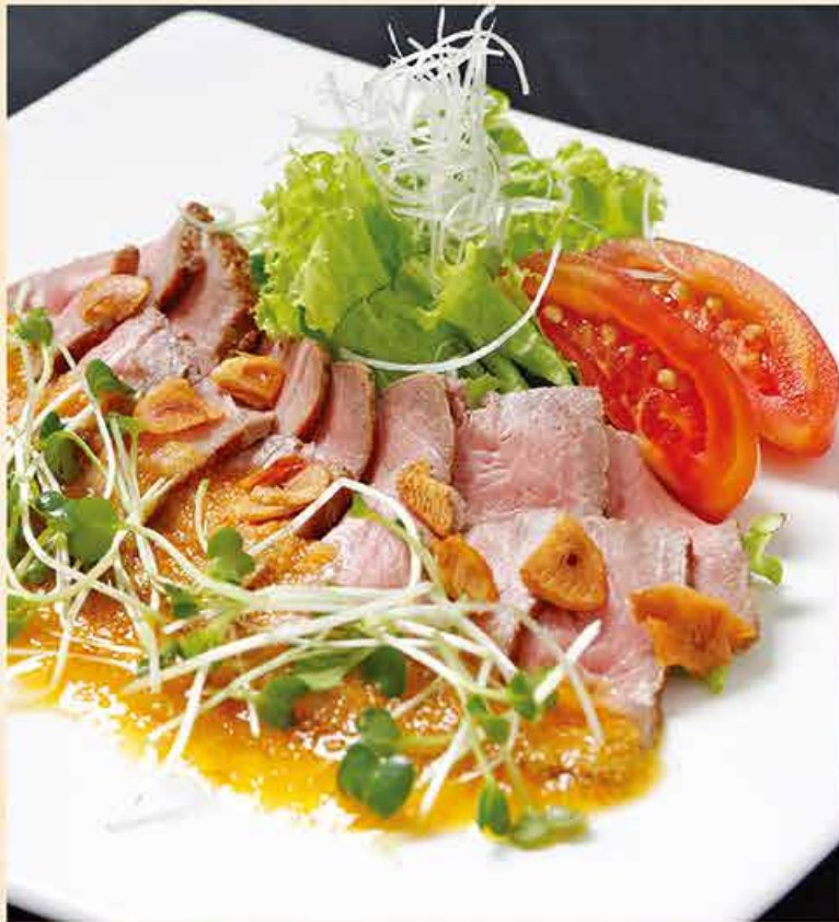
ローストビーフの旨味ソース