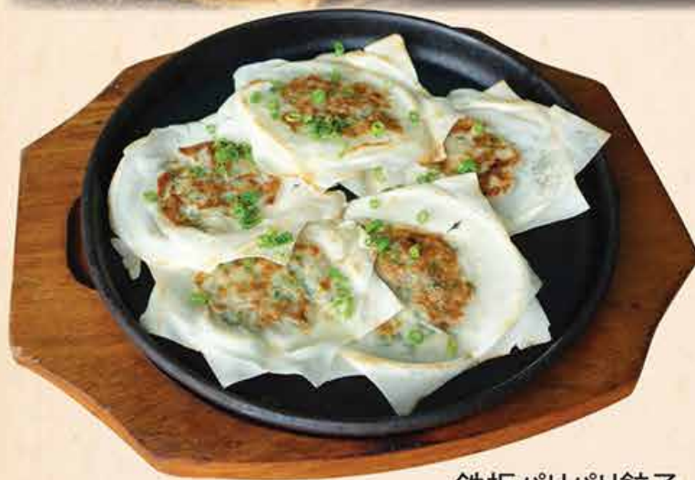
鉄板パリパリ餃子 78.000 vnd