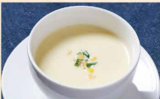
コーンスープ o 48.000 vnd