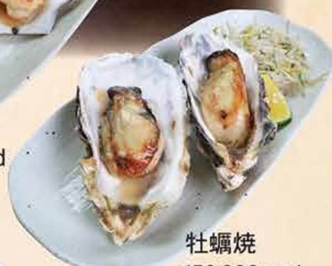
牡蠣焼 150.000 vnd