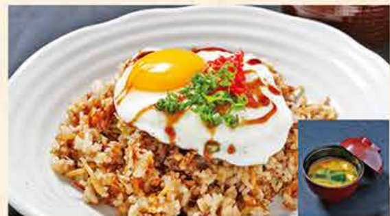
そば飯 (みそ汁付き) 108.000 vnd