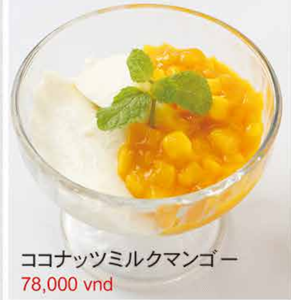
ココナッツミルクマンゴー 78,000 vnd