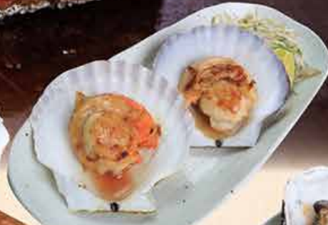
ホタテ焼 98.000 vnd