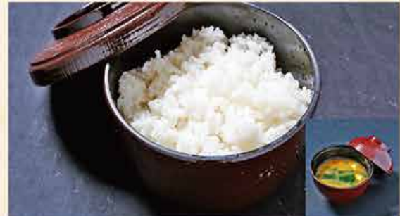
ご飯 (みそ汁付き) 35.000 vnd