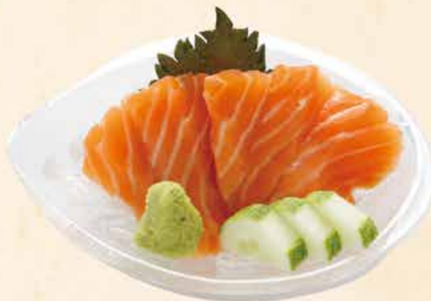
サーモンの刺身 118.000 vnd