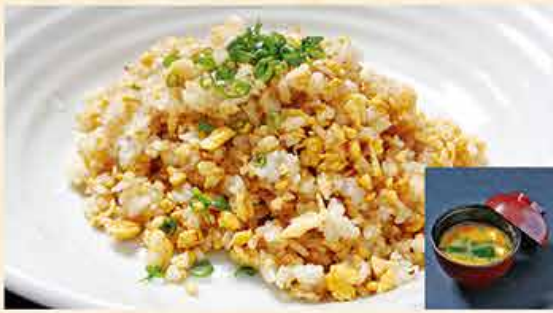
ガーリックライス (みそ汁付き) 78.000 vnd