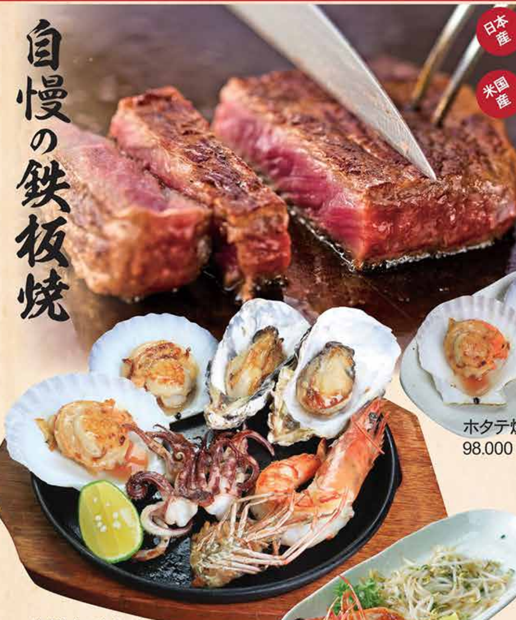
海鮮盛り合わせ 360.000 vnd