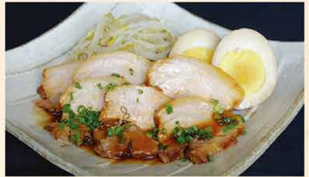
チャーシュー盛り