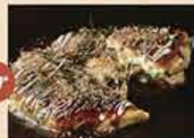
極みもっちりWチーズ