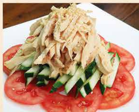
バンバンジーサラダ