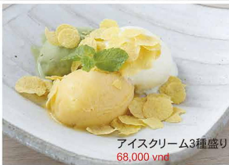
アイスクリーム3種盛り 68,000 vnd