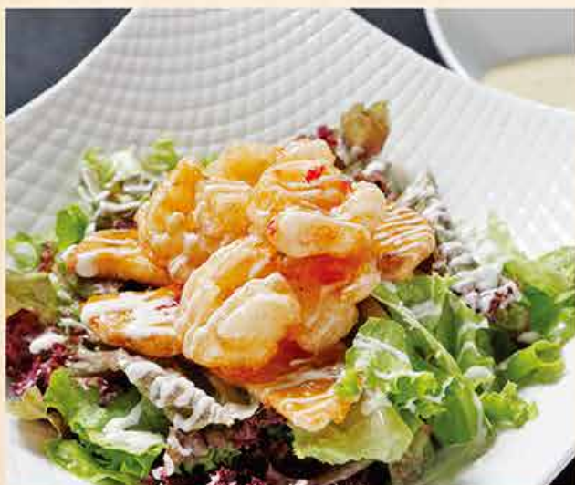
プリプリ海老のジャガイモサラダ