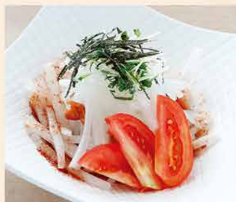
梅ドレのシャキシャキ 大根サラダ