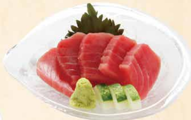
マグロ刺身 88.000 vnd