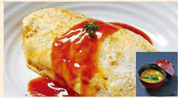
オムライス (みそ汁付き) 108.000 vnd