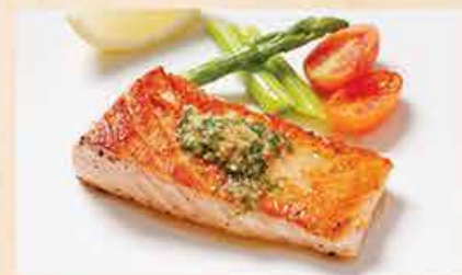
サーモンステーキの バターソース 190.000 vnd