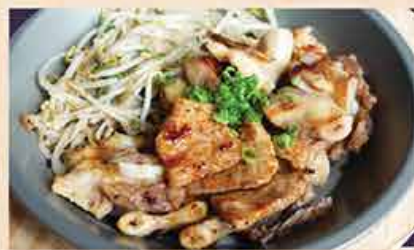
ホルモンミック焼 118.000 vnd