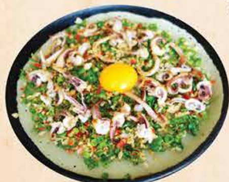
大阪イカ焼 98.000 vnd