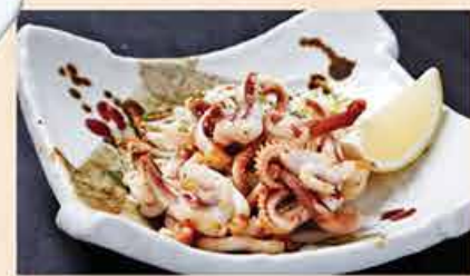
イカゲソ焼 68.000 vnd