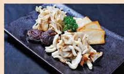
キノコのバター焼 78.000 vnd