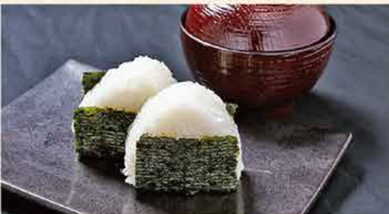
おにぎり (みそ汁付き) 68.000 vnd