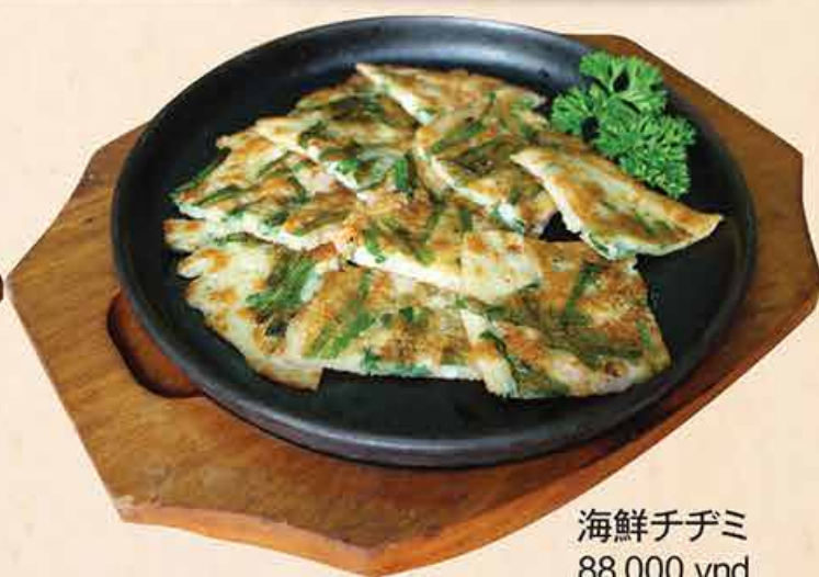
海鮮チヂミ 88.000 vnd