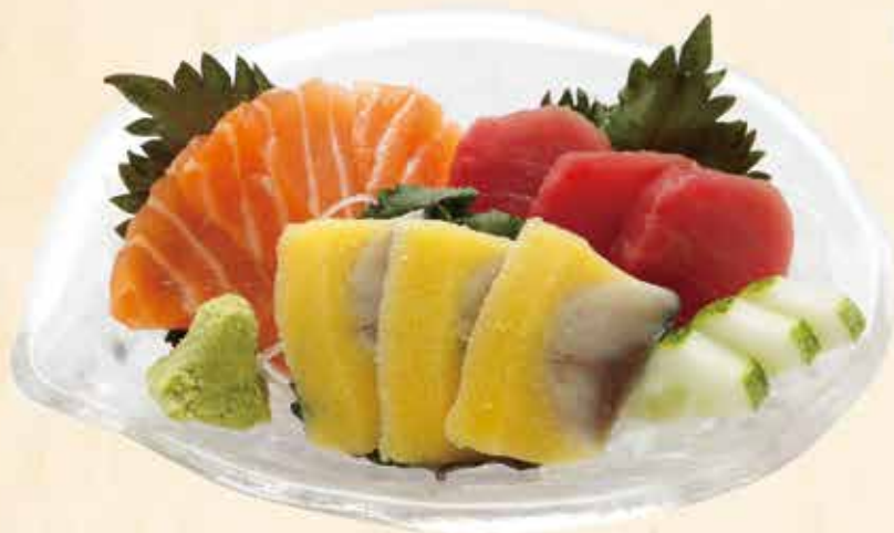
刺身盛り合わせ 178.000 vnd