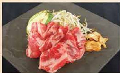
中落ちカルビの鉄板焼 180.000 vnd