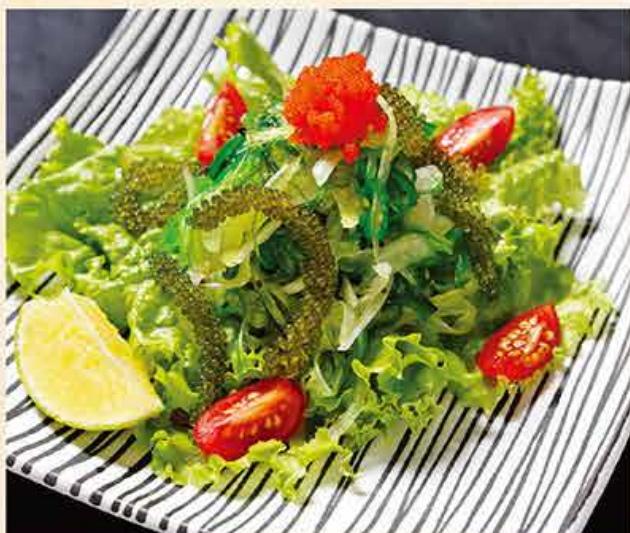
茎ワカメと海ブドウのサラダ