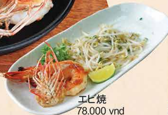
エビ焼 78.000 vnd