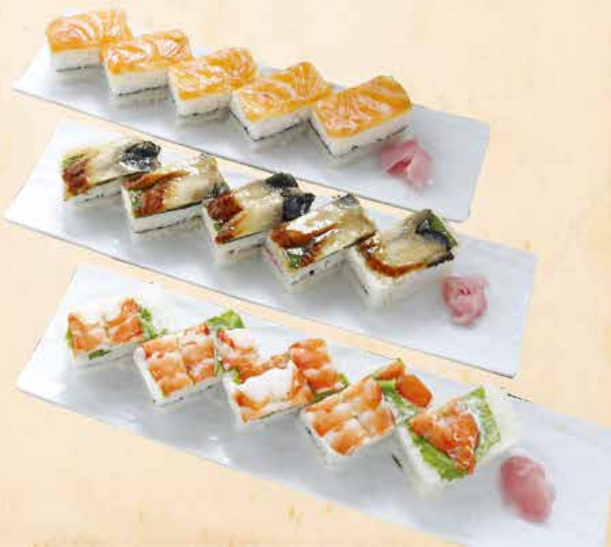
海老の押し寿司 98.000 vnd