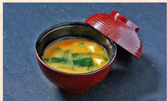
みそ汁 25.000 vnd