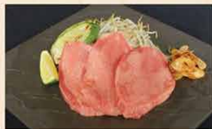
牛タンステーキ 160.000 vnd