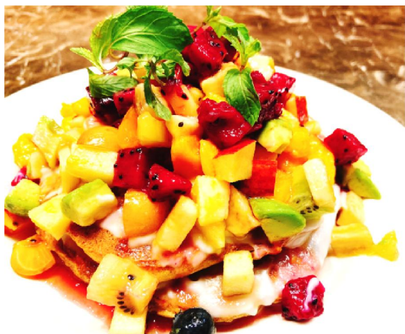
フルーツお好み焼

『フルーツお好み焼』と、“コーヒー”に発酵食品の“味噌”と“甘酒”をミックスし、滑らかな喉越しとお味の彩に拘りのコーヒーゼリーを。いつものコーヒーで発酵食品を摂取できる。まるやかで優しい深みのある健康ラテ、その名も『MISO ラテ』をマルコメ株式会社とのコラボ第一弾として販売いたします。お好み焼の柔軟性、甘酒や味噌の効能や活用方法とともに、健康的な日本の伝統食材の素晴らしさを訴求してまいります。